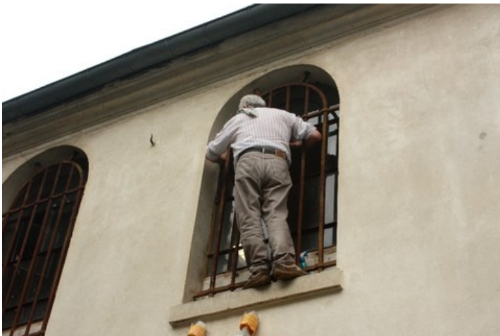
Photographies de Bernard leblanc de Cernex