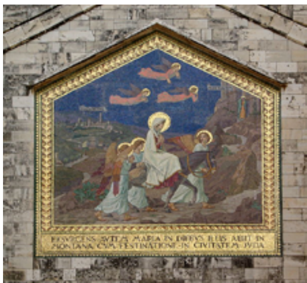
Visitation Aïn Karem

« Dans ce même temps, Marie se leva, et s'en alla en hâte vers les montagnes, dans une ville de Juda »