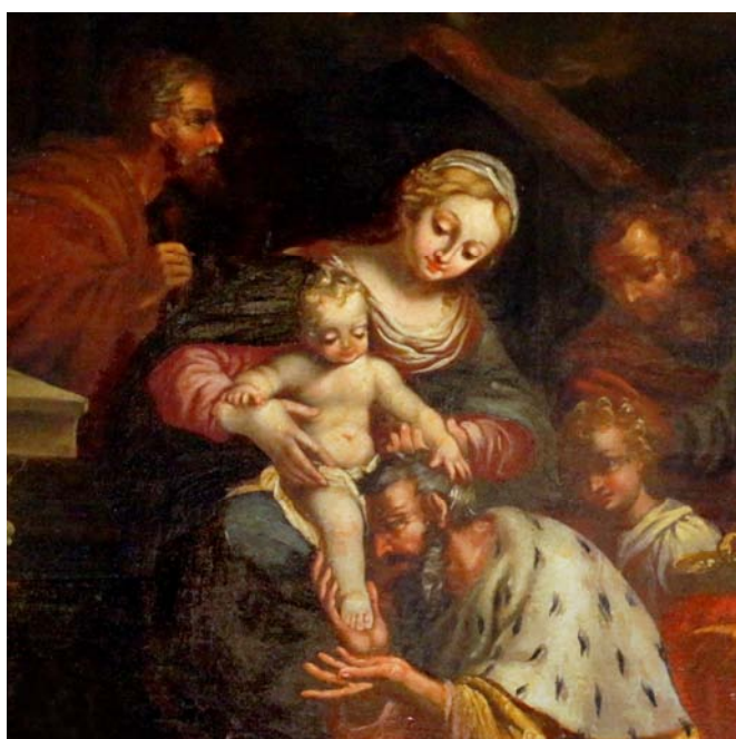
Fragment de « l'Adoration des Mages », tableau du XVIII e de notre église, inspiré de Rubens.

Cette année nous fêtons le Noël de l'Année de la foi ! Quand nous prions le Symbole des Apôtres, après l'affirmation concernant Dieu le Père, nous professons notre foi, « en Jésus-Christ, son Fils unique, notre Seigneur, qui a été conçu du Saint Esprit, est né de la Vierge Marie ».