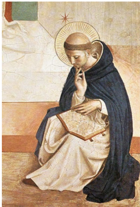
Saint Dominique au pied de la croix, couvent dominicain de San Marco, Florence - Fra Angelico

Dès 1207 il fixe un «port d'attache» à Prouille (dans l'Aude actuel) auprès d'une communauté de femmes revenues de la foi cathare. Mais en 1209 le pape déclenche la croisade contre les Albigeois et la violence des barons du nord déferle sur le Midi. En 1213, la croisade, à laquelle Dominique n'eut aucune part, semble militairement et politiquement terminée, le comte de Toulouse est dépossédé de ses terres ; cependant l'hérésie reste bien vivante ; pour y faire face Dominique fonde en 1215 à Toulouse, avec une seconde génération de missionnaires, un premier couvent avec pour programme la vie commune dans l'austérité, la prière chorale et l'étude de la parole de Dieu