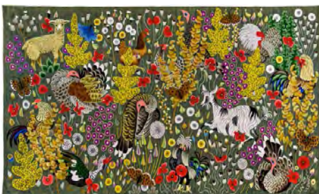
▲ « Plein champ », tapisserie de dom Robert.

Six tapisseries, parmi les plus emblématiques et les plus grands formats de l'artiste, sont exposées dans la nef de la cathédrale, donnant à tous de contempler une création magnifiée, rayonnante et respectée de manière opiniâtre, par un artiste qui passa sa vie à l'observer, la contempler, à traquer le réel qu'il entendait donner à voir, comme en témoignent aussi nombre de croquis, dessins et cartons de tapisseries présentés sur les cartels.