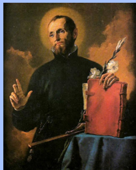
Saint Gaëtan de Thiène 1480-1547 Fête le 7 août

« Ne va pas à la rencontre de l'autre pour le convaincre de devenir catholique, non, non, va le rencontrer parce qu'il est ton frère ! » Message du Pape François pour la Saint Cayetano, patron des travailleurs argentins