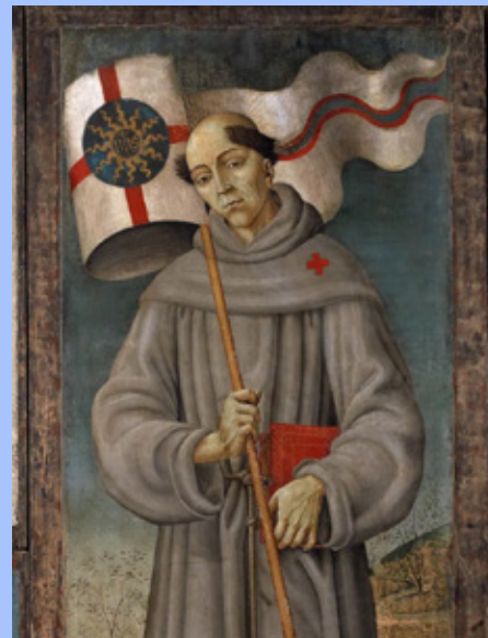
Saint JEAN de CAPISTRAN