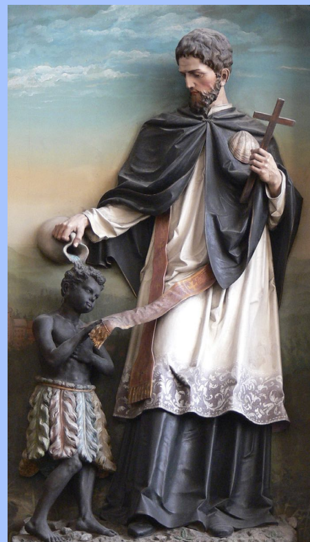
Saint François-Xavier Fête le 3 Décembre

« Pensez-y bien, le monde est un maître qui promet et qui ne tient pas parole. Et quand même il tiendrait ses promesses à votre égard, jamais il ne pourra contenter votre cœur. Mais supposons qu'il le contente, combien de temps durera votre bonheur ? En tout cas, pourra-t-il durer plus que votre vie ? Et à la mort, qu'emporterez-vous dans l'éternité ? Que sert à l'homme de gagner l'univers entier, s'il vient à perdre son âme ? » Maxime d'Ignace de Loyola, ancrée dans le cœur de François-Xavier.