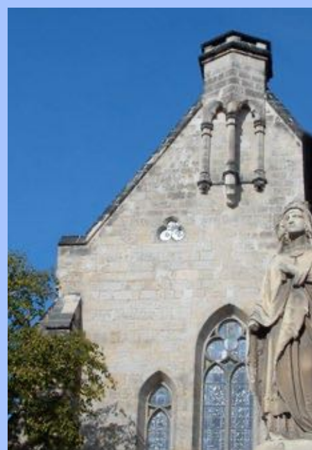
Statue, église Sainte-Mathilde à Quedlinbourg, Allemagne.