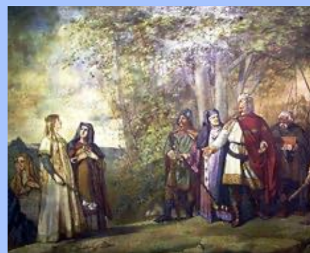
Henri demande la main de Mathilde, tableau du XIX e siècle.