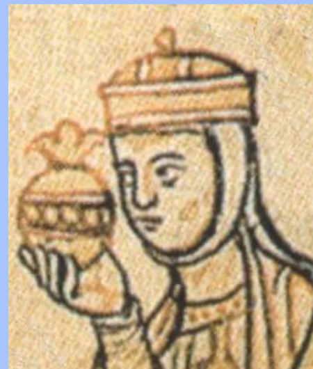
Mathilde, Généalogie des Ottoniens, XII e siècle.