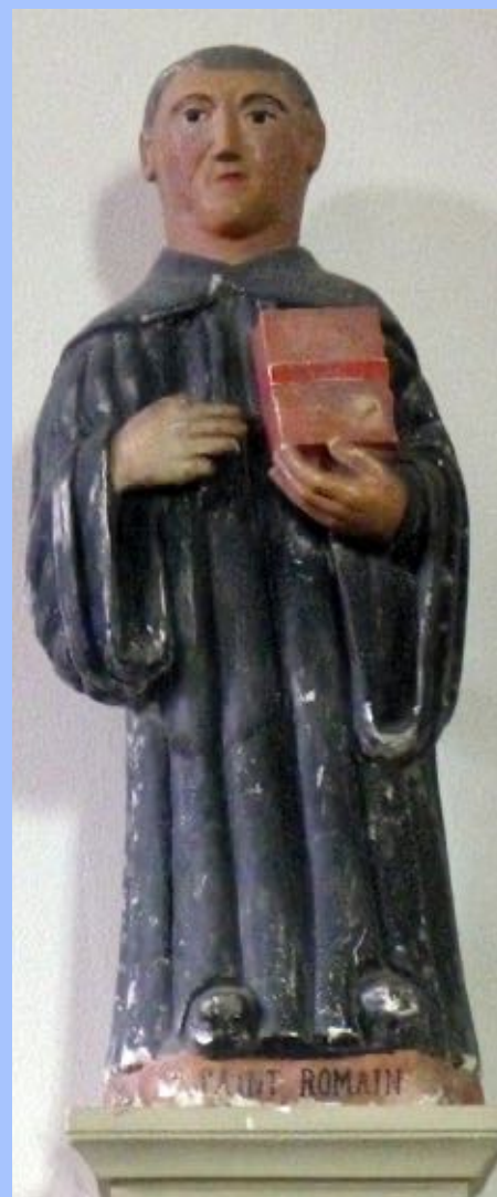
Statue de Romain de Condat dans l'Église Saint-Pierre-et-Saint-Romain de Savennières.

Sentant sa mort venir, Romain rend visite une dernière fois à sa sœur, puis fait venir ses religieux auprès de lui pour les saluer et les reconforter avant de céder à son frère la supervision des monastères.